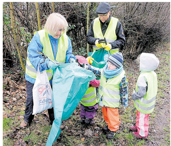
Die Müllsammelaktion voriges Jahr war ein voller Erfolg. Daran wollen die VVV-Mitglieder anknüpfen.

Bei „Das Fest“ im Mai wird der Verkehrs- und Verschönerungsverein vor dem Bürgerzentrum an der Telegrafstraße an einem Stand über die Arbeit informieren. Es gibt zudem einen Luftballonwettbewerb für Kinder.