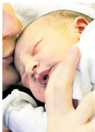
Die Bindung zwischen Mutter und Kind ist wichtig.

Beratungsstelle Jahnstraße lädt Elternteile mit Babys ein.